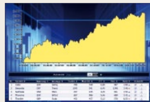
Mercado de ações totalmente automatizado de dia e de noite.