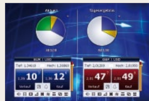
Trading rápido, objetivo.

COM O TRADEMASTER® O MERCADO DE AÇÕES FOI REVOLUCIONADO E REDEFINIDO.