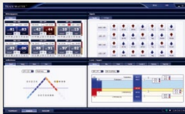
Últimos métodos e ferramentas de análise para uma negociação objetiva e bem sucedida na bolsa

Esta Clientsolution foi desenvolvida com tecnologias de vanguarda. Esta inclui, além da programação segundo os critérios atuais mais avançados, também a redundância do sistema para garantir um bom resultado, uma Serversolution redundante, assim como, naturalmente, uma transmissão de dados especialmente criptografada. Desta forma é assegurada uma segurança máxima nas transações. A tecnologia Order de duas vias integrada se baseia em diversas Api-Connections e encerra um suporte suplementar pelo protocolo FIX usual nos bancos. Desta forma seria teoricamente possível ao comerciante, através do TradeMaster®, executar 170.000 Trades – por segundo!