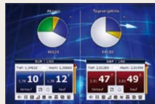
Un Trading rapide et orienté vers les objectifs

AVEC TRADEMASTER, LA TRANSACTION BOURSIÈRE EST RÉVOLUTIONNÉE ET REDÉFINIE.