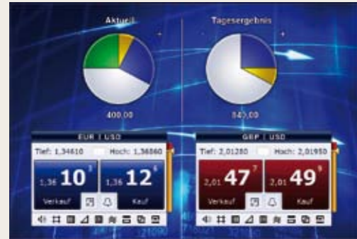
Hızlı ve hedefe dönük işlemler

TRADEMASTER İLE DÖVİZ TİCARETİ DEVRİM YAŞAYIP YENİDEN TANIMLANIYOR.