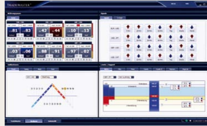
Hedefe dönük başarılı işlemler için en yeni analitik metodlar ve araçlar.

teknolojiler kullanılarak geliştirilmiştir. Son teknoloji ürünü programlamanın yanı sıra, işlemlerinizi güvenlik altına almak adına sistem yedeklemesi, sunucu yedekleme çözümleri ve tabii ki özellikle veri şifreleme sistemleri kullanılmıştır. Böylece mümkün olan en yüksek oranda işlem güvenliği sağlanmıştır. Entegre edilen çift yönlü emir teknolojisi çeşitli Api-Bağlantılarına dayanmaktadır ve standart FIX bankacılık Protokolü aracılığıyla ilave destek de sağlamaktadır. Bu sayede teorik olarak piyasa oyuncusunun TradeMaster® üzerinden saniyede 170.000 işlem gerçekleştirmesi mümkün olabilmektedir.