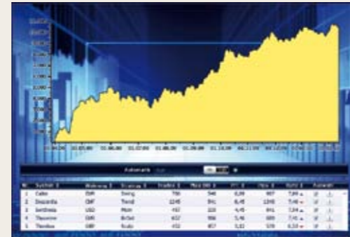
24 Saat kesintisiz tam otomatik döviz işlemleri