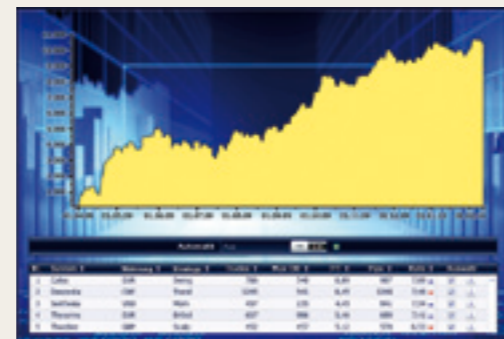
การทำธุรกิจหลักทรัพย์และหุ้นอัตโนมัติ และทำได้ตลอด 24 ชั่วโมง