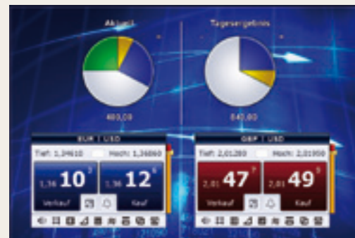
การทำธุรกิจหลักทรัพย์และหุ้นที่มีเป้าหมายชัดเจน

TradeMaster® คือนวัตกรรมใหม่ในธุรกิจตลาดหลักทรัพย์และการคำนวณสำหรับนักธุรกิจหลักทรัพย์และหุ้น