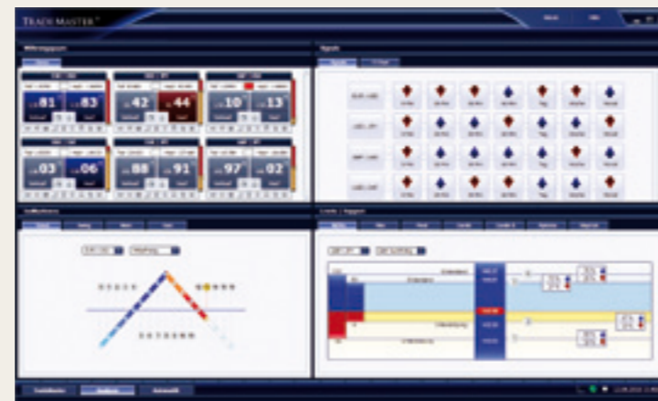
ทำธุรกิจหลักทรัพย์และหุ้นด้วยการใช้วิธีวินิจฉัยระบบใหม่ด้วยเครื่องมือใหม่

ระบบการสั่งผ่านทางขนานซึ่งเป็นระบบ Ordertechnology บนพื้นฐานของเอฟคอนเนกชันซึ่งประกอบด้วยบันทึกประจำวันนี้เป็นระบบที่ไช้กันในสถาบันการเงินโดยทั่วไปที่ไช้ชื่อว่า FIX-Protokoll ดังนั้นสำหรับนักธุรกิจที่ไช้ TradeMaster® จะสามารถจัดการธุรกิจหลักทรัพย์การซื้อขายได้ 170,000 ครั้งต่อหนึ่งวินาทีถ้าต้องการในทางทฤษฎี