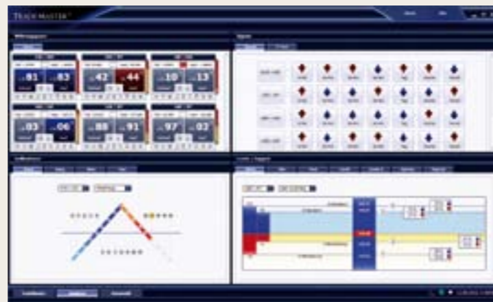
Los métodos y herramientas de análisis más modernos para un comercio bursátil eficaz con objetivos claros.

Esta solución de cliente ha sido desarrollada con la tecnología más innovadora. A ésta pertenecen junto a la programación del más alto nivel actual además los sistemas redundantes para el almacenamiento de resultados, una solución de servidor redundante y naturalmente una transmisión de datos especialmente codificada. De este modo se garantiza la máxima seguridad en las transacciones. La tecnología de orden de dos vías integrada está basada en diversas conexiones Api y contiene un soporte adicional gracias al protocolo FIX de uso bancario habitual. Con ello, TradeMaster® facilitaría teóricamente al negociante la realización de 170.000 operaciones – por segundo.