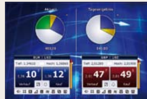
빠르고 목표가 확실한 거래.

TradeMaster®로 주식 거래는 혁명적인 변화를 맞아 새롭게 정의됩니다.