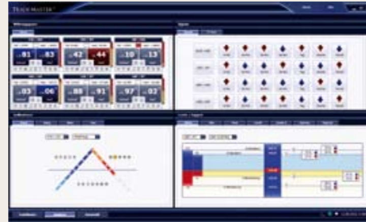
적확한 성공적 주식 거래를 위한 최신 분석 방법과 도구.

에는 현재의 최고 기준에 의한 프로그래밍 외에 또한 결과 확보를 위한 시스템 여유도, 여유 서버 솔루션 및 특별 변조 데이터 이전이 있습니다. 이렇게 하여 최대한의 거래 안전이 보장됩니다. 통합 양방향 주문 기술은 다양한 Api 연결을 바탕으로 하고 은행에서 일반적으로 볼 수 있는 FIX 프로토콜에 의한 추가 지원을 포함하고 있습니다. 이로써 순수하게 이론적으로는 거래자가 TradeMaster®를 통해 초당 170,000 건의 거래를 수행하는 것이 가능해집니다!