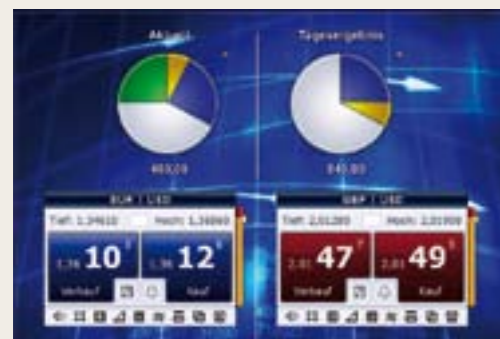
Trading rapido e orientato al risultato.

TRADEMASTER RIVOLUZIONA E RIDEFINISCE IL TRADING IN BORSA.