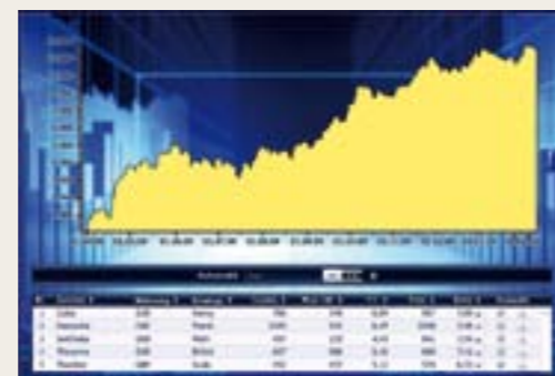
Trading completamente automatico 24 ore su 24.