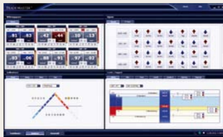
I più recenti strumenti e metodi di analisi per negoziare in borsa in modo mirato ed efficace.

Questa soluzione client è stata sviluppata con tecnologie innovative, tra le quali, oltre a una programmazione eseguita secondo gli standard attuali più elevati, si contano anche le ridondanze di sistema per garantire risultati costanti, un server ridondante e naturalmente una trasmissione dati codificata in modo specifico. In questo modo è possibile eseguire transazioni usufruendo della massima sicurezza. Il sistema, con sincronizzazione delle cartelle a due vie, si basa su diverse connessioni Api e contiene strumenti supplementari grazie al protocollo FIX, il sistema standard del settore bancario. In teoria è possibile eseguire mediante TradeMaster® 170.000 trade al secondo!