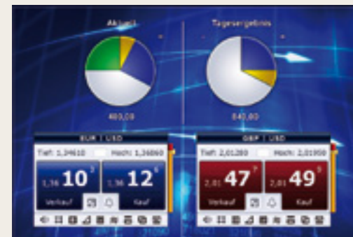
交易快捷、目標明確