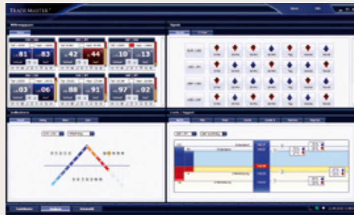
最新的分析方法和工具，確保您成功交易！

此客戶解決方案運用各種尖端技術，其中包括最高水平的程序、交易安全系統冗余、冗余服務器方案及專業加密數據傳輸，在最大限度上保證了交易安全。還集成了基於各種API鏈接的雙向訂單技術，並使用標準的銀行FIX協議提供額外的支持。因此在理論上，TRADEMASTER®每秒鐘能執行170000次交易。