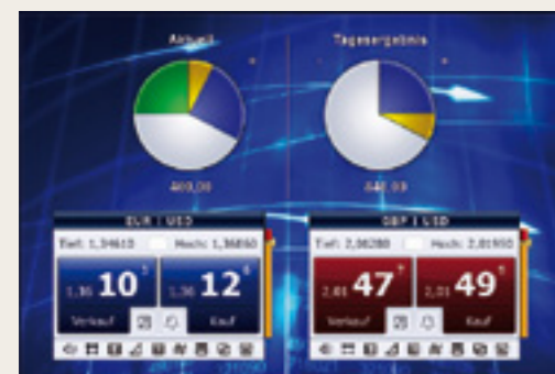
交易快捷、目标明确