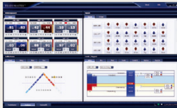
最新的分析方法和工具，确保您成功交易！

此客户解决方案运用各种尖端技术，其中包括最高水平的程序、交易系统冗余、冗余服务器方案及专业加密数据传输，在最大限度上保证了交易安全。还集成了基于各种API链接的双向订单技术，并使用标准的银行FIX协议提供额外的支持。因此在理论上，TRADEMASTER®每秒钟能执行170000次交易。